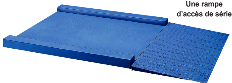
Une rampe d'accès de série